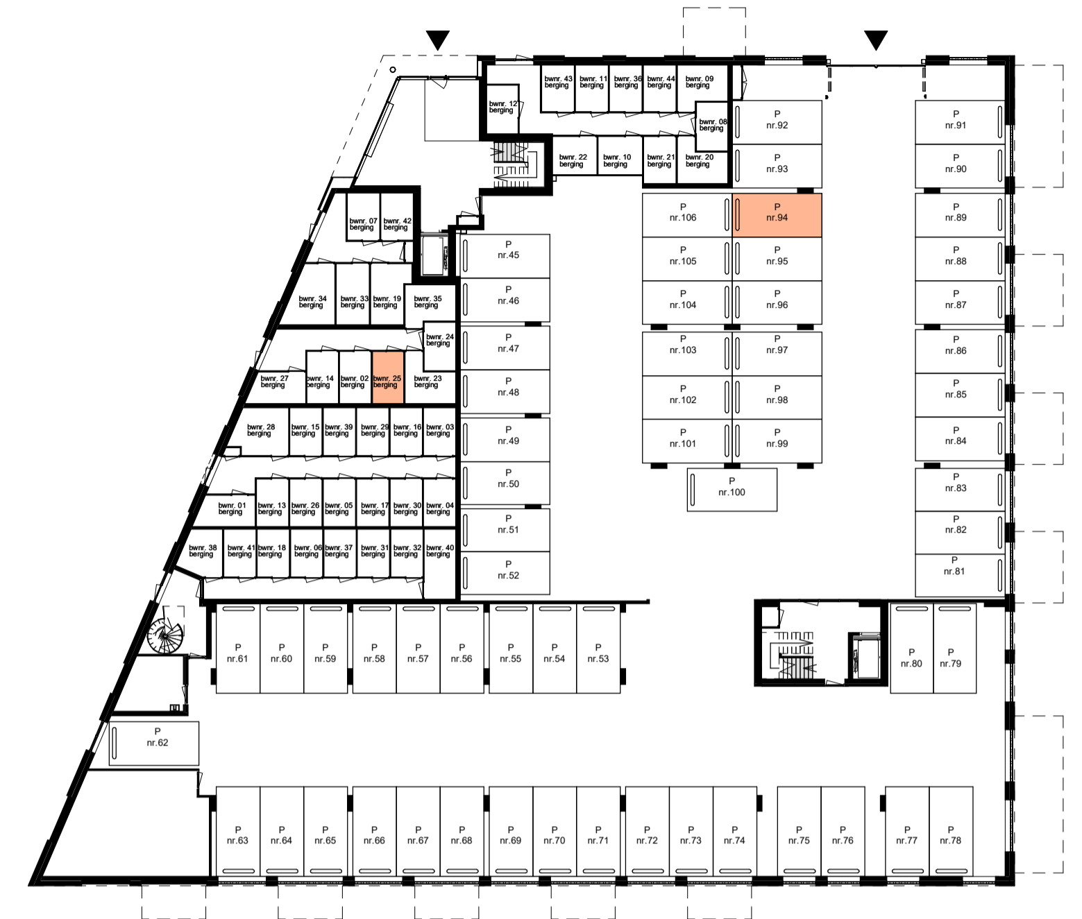
Begane grond niet op schaal